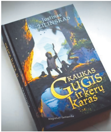
J. Žilinsko knygos „Kaukas Gugis ir kerų karas“ viršelis.

Autorius į lietuvių magiškosios fantastikos lauką atvedė savitą herojų – mažą ir gudrų kaukavaikį Gugį. Jis panašus į šaunųjį Robiną Hudą ir indėniuką Harką. Nuotykių kupina istorija spėjo tapti šeimos knyga – ją skaitė ir vaikai, ir tėvai. Ji pateko į geriausių Metų knygų penketuką ir gavo Tarptautinės vaikų ir literatūros asociacijos (IBBY) apdovanojimą. Naujojo-