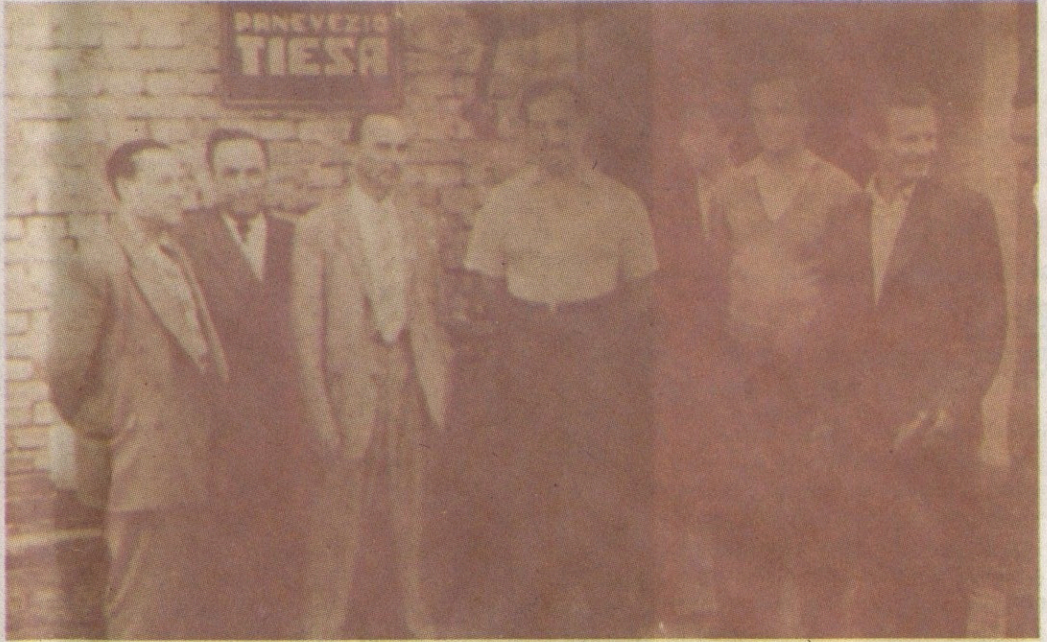
NUOTRAUKOS IŠ A. ŠIMKŪNO ALBUMO

„Panevėžio tiesos“ darbuotojai su į svečius atvykusiu Amerikos lietuvių atstovu – laikraščio redaktoriumi (trečias iš kairės).